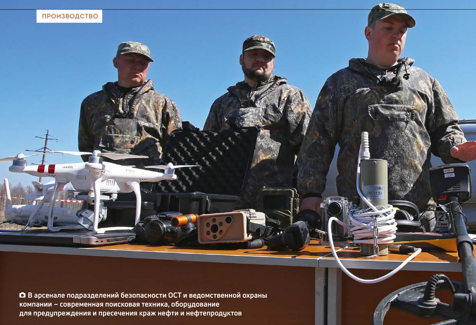
📷 В арсенале подразделений безопасности ОСТ и ведомственной охраны компании – современная поисковая техника, оборудование для предупреждения и пресечения краж нефти и нефтепродуктов